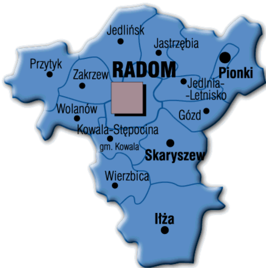
Rysunek 1. Położenie gminy Jedlińsk w powiecie radomskim

Jedlińsk był lokowany w 1530 r. przez Mikołaja Jedleńskiego na mocy przywileju Zygmunta I. Miasteczko posiadało prawo miecza od 1540 r., czyli prawo ścinania przestępców podczas publicznych egzekucji, z którego skorzystano w 1778 r. W latach 1560-1630 Jedlińsk pełnił rolę ważnego ośrodka arian (braci polskich), którzy prowadzili zbór i szkołę podległą Akademii Rakowskiej i zbór. W drugiej połowie XVII w. i w XVIII w. miejscowe gimnazjum nadzorowała Akademia Krakowska. Od 1630 r. Jedlińsk należał do rodziny Witowskich, później Załuskich. Najazd szwedzki w 1655 r. spowodował zniszczenie miasteczka. W 1869 r. Jedlińsk utracił prawa miejskie, stając się niewielką osadą. W 1794 r. w pobliżu Jedlińska kwaterował Tadeusz Kościuszko, przemieszczający się z wojskiem w kierunku Warszawy 11 czerwca 1809 r. rozegrała się tu bitwa wojsk Księstwa Warszawskiego z Austriakami, mogiła poległych znajduje się przy drodze do Woli Gutowskiej.