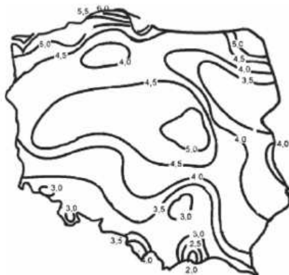
Rys. 1 Mapa zasobów wiatru wg pomiarów IMCW na wysokości 30 m n.p.g. dla terenu o klasie szorstkości „0-1”