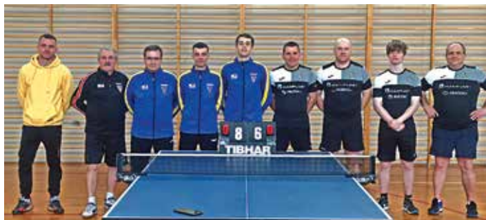
● Drużyna ULKS Viktoria Jedlińsk i Mateus I Żąbki po meczu zakończonym wygraną Viktorii.

Aż do 19-tej kolejki kibice GKS-u musieli czekać, by ich ulubieńcy zdobyli pierwszy punkt w rozgrywkach IV ligi mazowieckiej. Futboliści Jedlińska