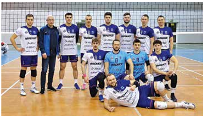
● Po zwyciężkim meczu z PSG KPS Siedlce.